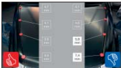
Zasady kontroli części zamiennych.

N.W.: A propos jakości. Pisaliśmy w tym roku o nowym standardzie jakości eQ-element®. Przypomnijmy co to jest. A.S.: Mówimy na ten asortyment "części o jakości oryginałów w cenach zamienników".